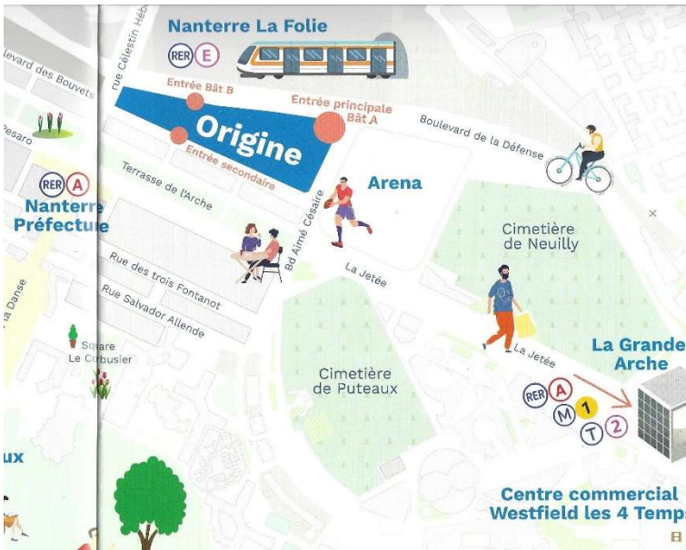
Localisation de l'immeuble ORIGINE

NB : Le service Sécurité demande votre adresse électronique pour vous adresser l'induction Sécurité de l'immeuble et l'immatriculation de votre véhicule est nécessaire pour le contrôle optique d'accès au parking. Nous vous recommandons de vous garer au parking visiteurs BATIMENT A.